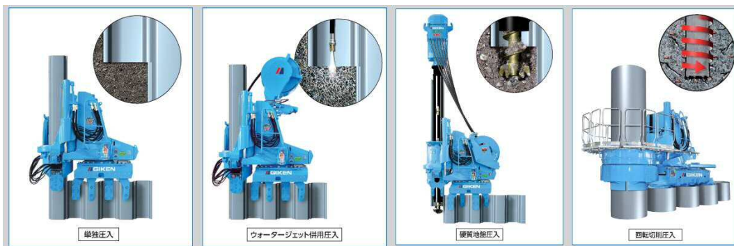
地盤条件による貫入技術