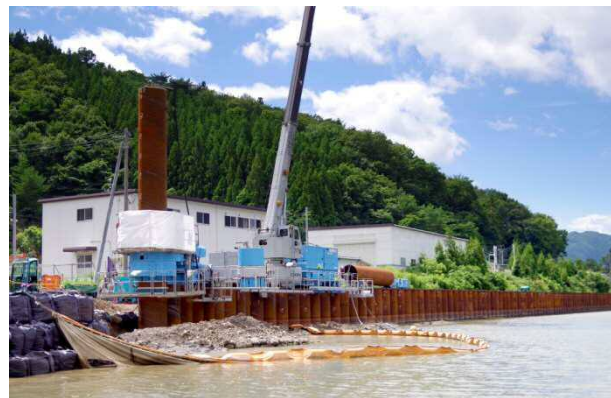
災害復旧や防災・減災工事の施工例